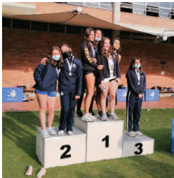
Relevo 4 X 100 m juvenil femenino