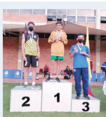
2000 m cross infantil masculino