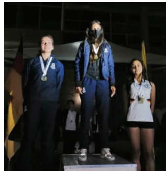
100 m planos juvenil femenino