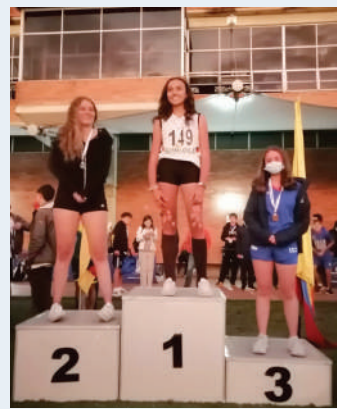
Lanzamiento de jabalina juvenil femenino