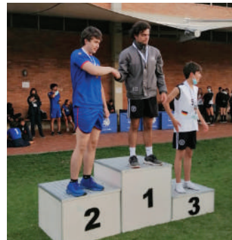
Impulsión de bala mayores masculino