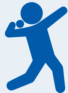
Impulsión de bala infantil masculino