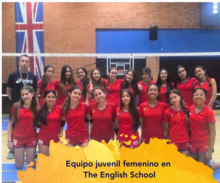
Equipo juvenil femenino en The English School