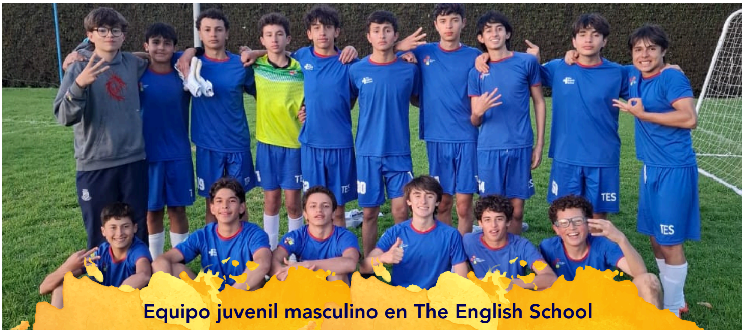
Equipo juvenil masculino en The English School