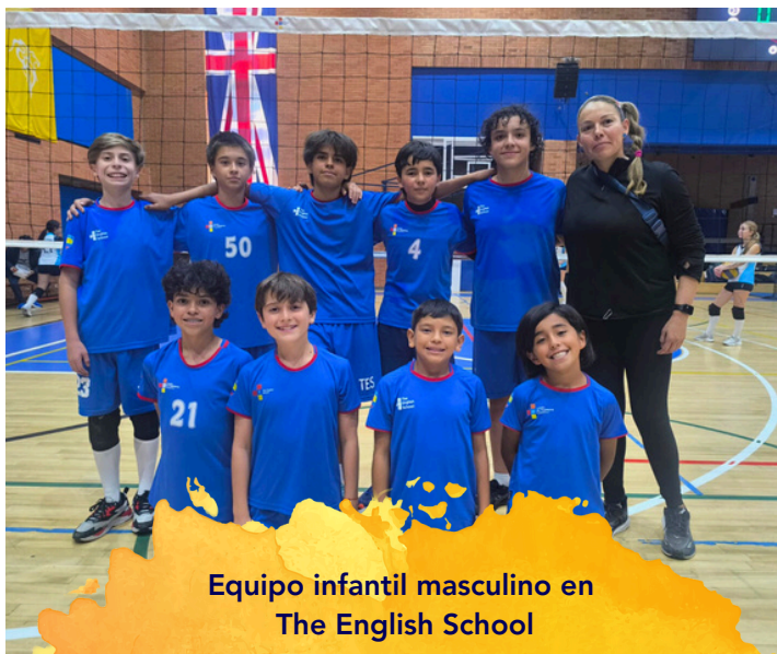
Equipo infantil masculino en The English School